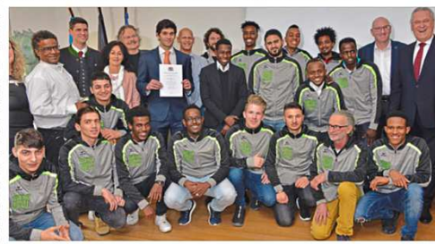
Laut Minister Joachim Herrmann (rechts) ein „leuchtendes Vorbild: Das „Migranten-Fußballteam“ aus Freilassing und Saaldorf-Surheim.

Innenminister Joachim Herrmann gratulierte den Preisträgern: „Sie zeigen mit Ihrem herausragenden Initiativen ein drucksvoll, wie Integration vor Ort gelingen kann. Mit Ihrem Engagement sind sie anderen ein leuchtendes Vorbild.“ Er lobte die Ehrenamtlichen, dass Werte und Menschlichkeit vorgelebt werden. Dadurch könne Würde, Freiheit und Gleichberechtigung, Achtung und Respekt funktionieren. Dieses Fundament sei nicht verhandelbar. Er habe die Erwartung, dass sich alle an die Rahmenbedingungen halten. Integration fördern und fördern, es gebe viele Möglichkeiten im breiten Angebot. Doch seien es immer noch die Ehrenamtlichen, ohne die derzeit Integration nicht funktionieren würde. Darum könne man dieses Engagement nicht hoch genug wertschätzen. „Sie sind diejenigen, die sich tagtäglich vor Ort für Integration einsetzen und sie mit Leben erfüllen.“ Hilfestellung, Informationen und Auskünfte würden Geflüchtete und Ehrenamtliche von den Integrationslotsen erhalten, die inzwischen in 81 von 96 Landkreisen und kreisfreien Städten eingesetzt sind. Integration gelinge in Bayern besonders gut, weil viele Institutionen und Kommunen zusammenarbeiten, so die Worte Herrmanns.