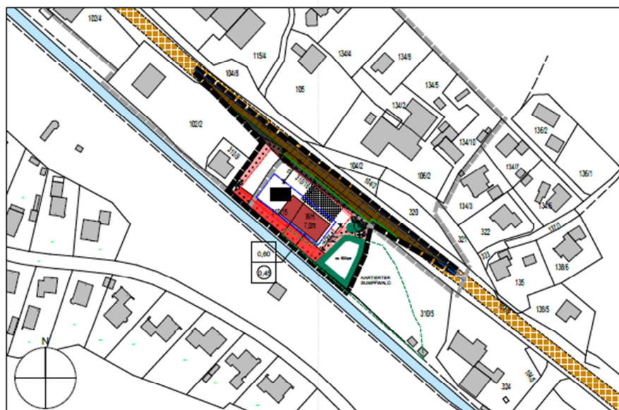
Planzeichnung M. 1/1000 für den Geltungsbereich A